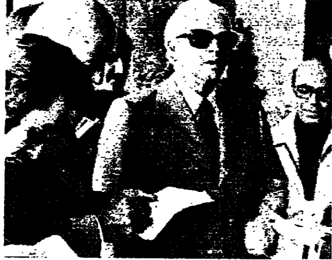
الرئيس شمعون بجلي بتصرحه الى الصحفيين